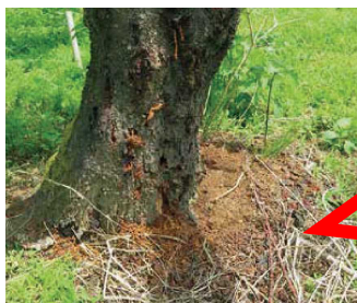
クビアカツヤカミキリのフラス