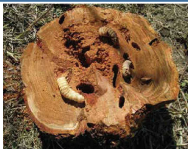
クビアカツヤカミキリの幼虫